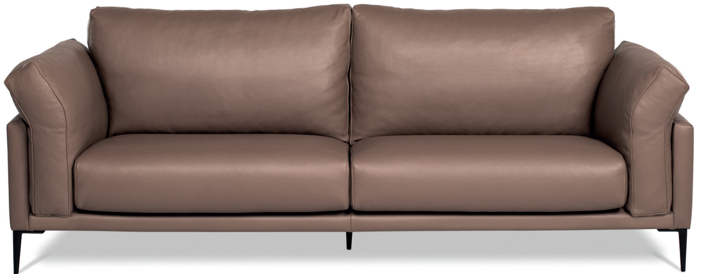
Canapé 3 places cuir Puma Taupe