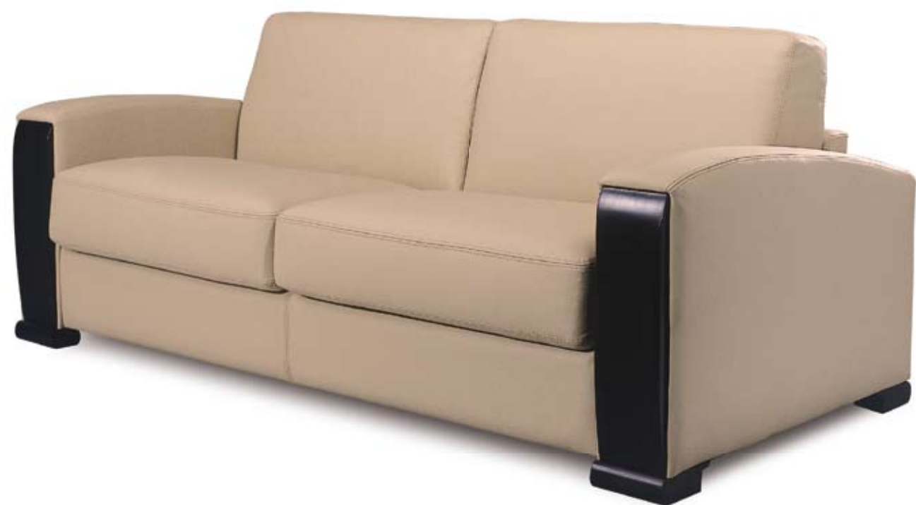
Canapé 3 places cuir Nevada Mastic