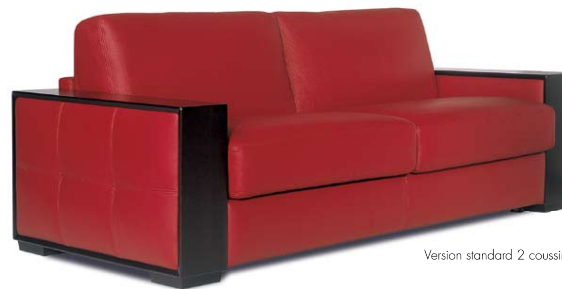
Version standard 2 coussins