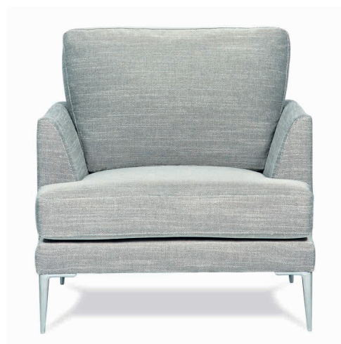
Fauteuil tissu Chandra AA2, pieds acier chromé